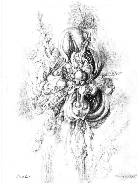
Ljubodrag Janković–Jale, Rascvetavanje , 1965 (crtež)