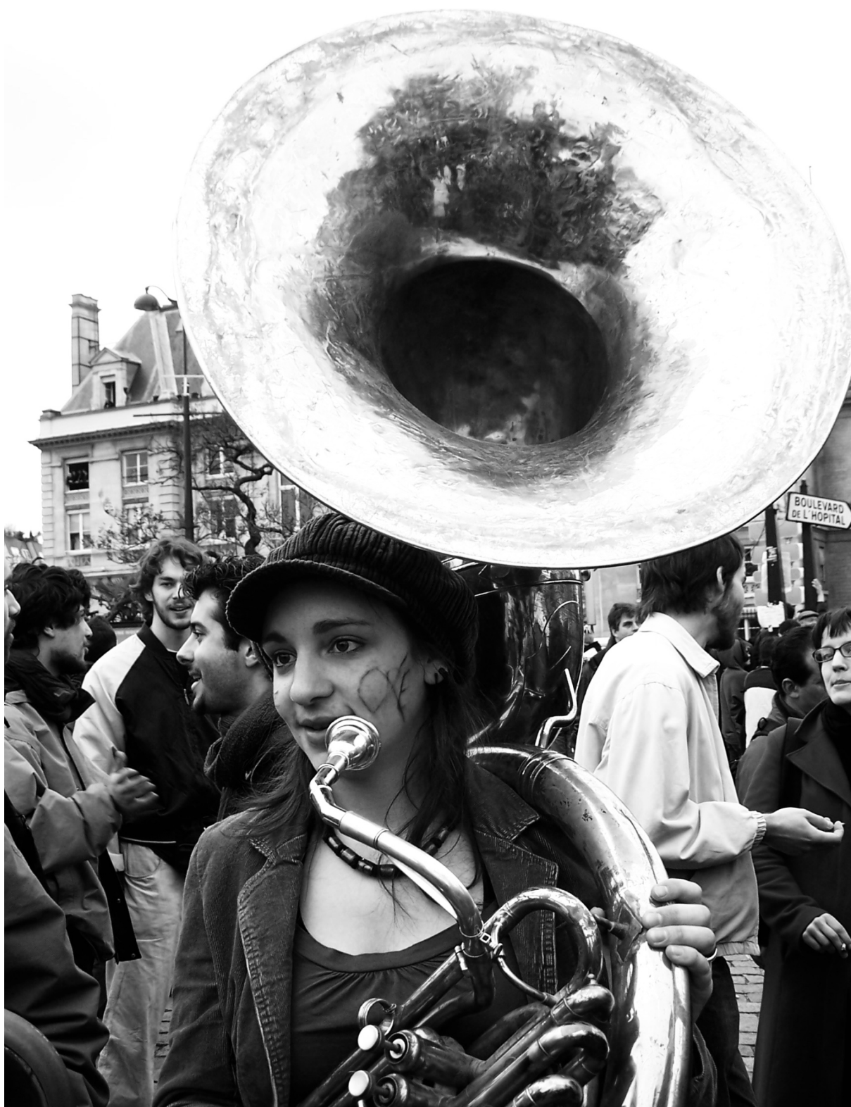
Šampioni Evrope, Beograd 2004 Champions d'Europe, Belgrade 2004