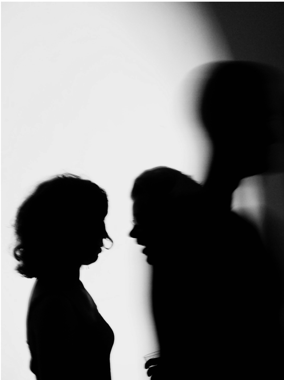
Radost, Pariz 2006 Joie, Paris 2006