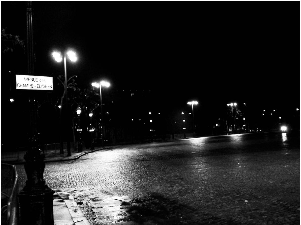
Najlepša avenija, Pariz 2004 La plus belle avenue, Paris 2004