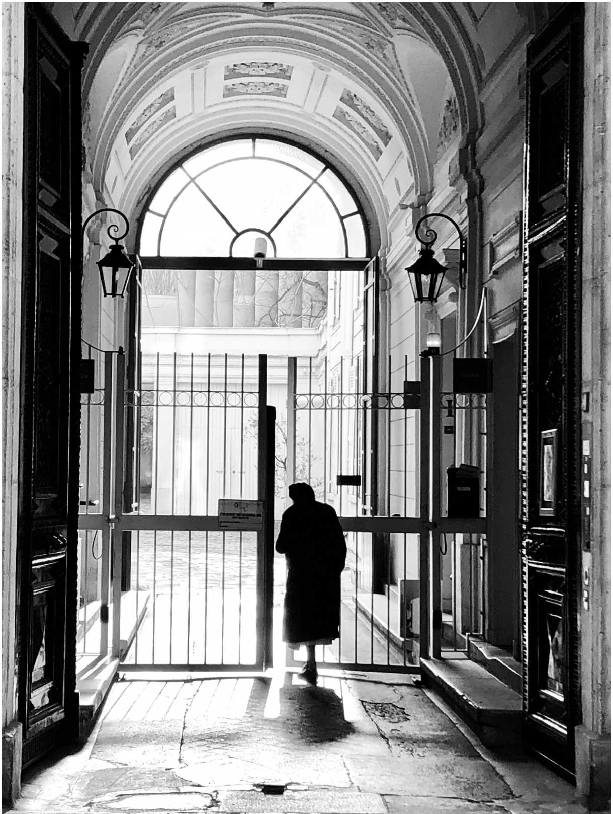
Ulaz, Pariz 2018 Entrée, Paris 2018