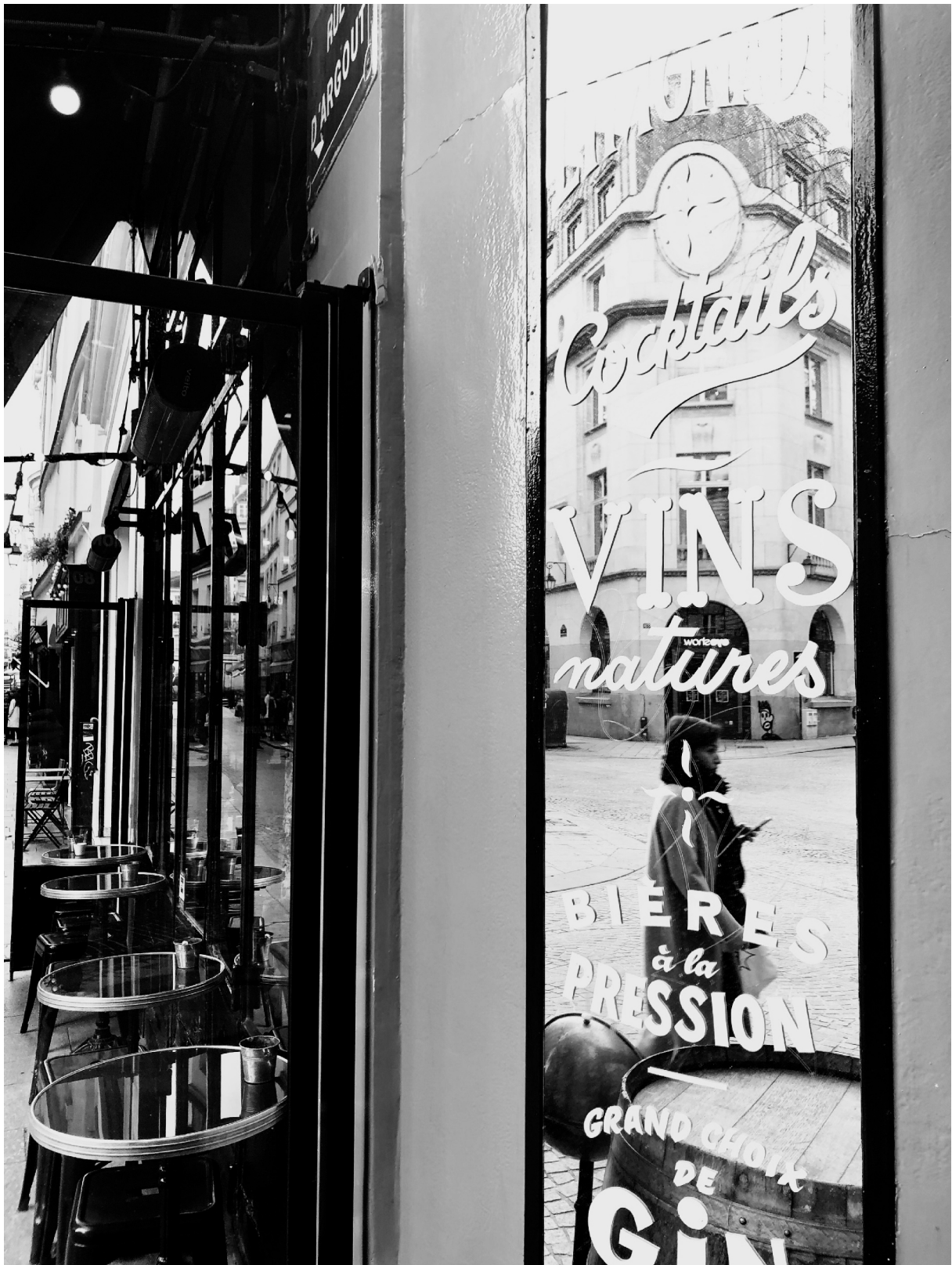
Zmaj, Pariz 2015 Dragon, Paris 2015