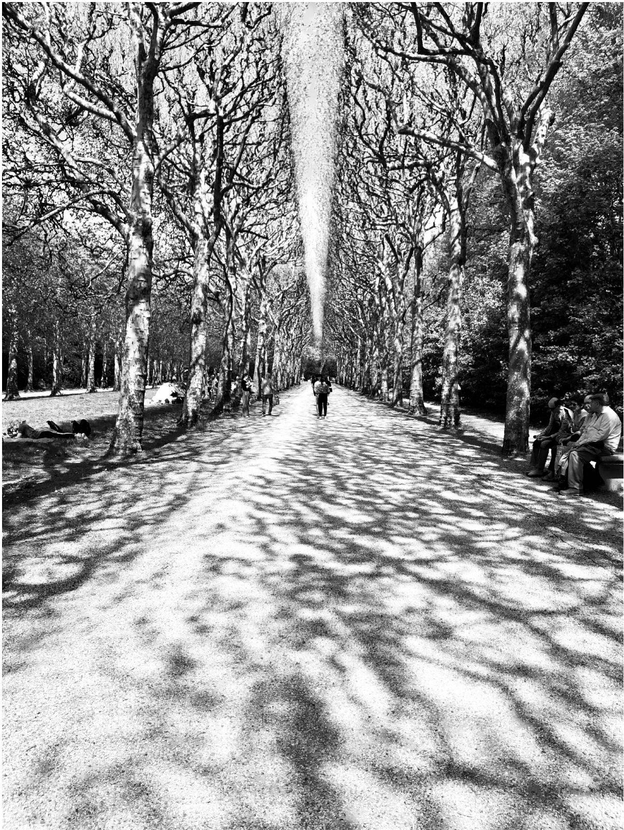
Pijaca, Pariz 2019 Marché, Paris 2019