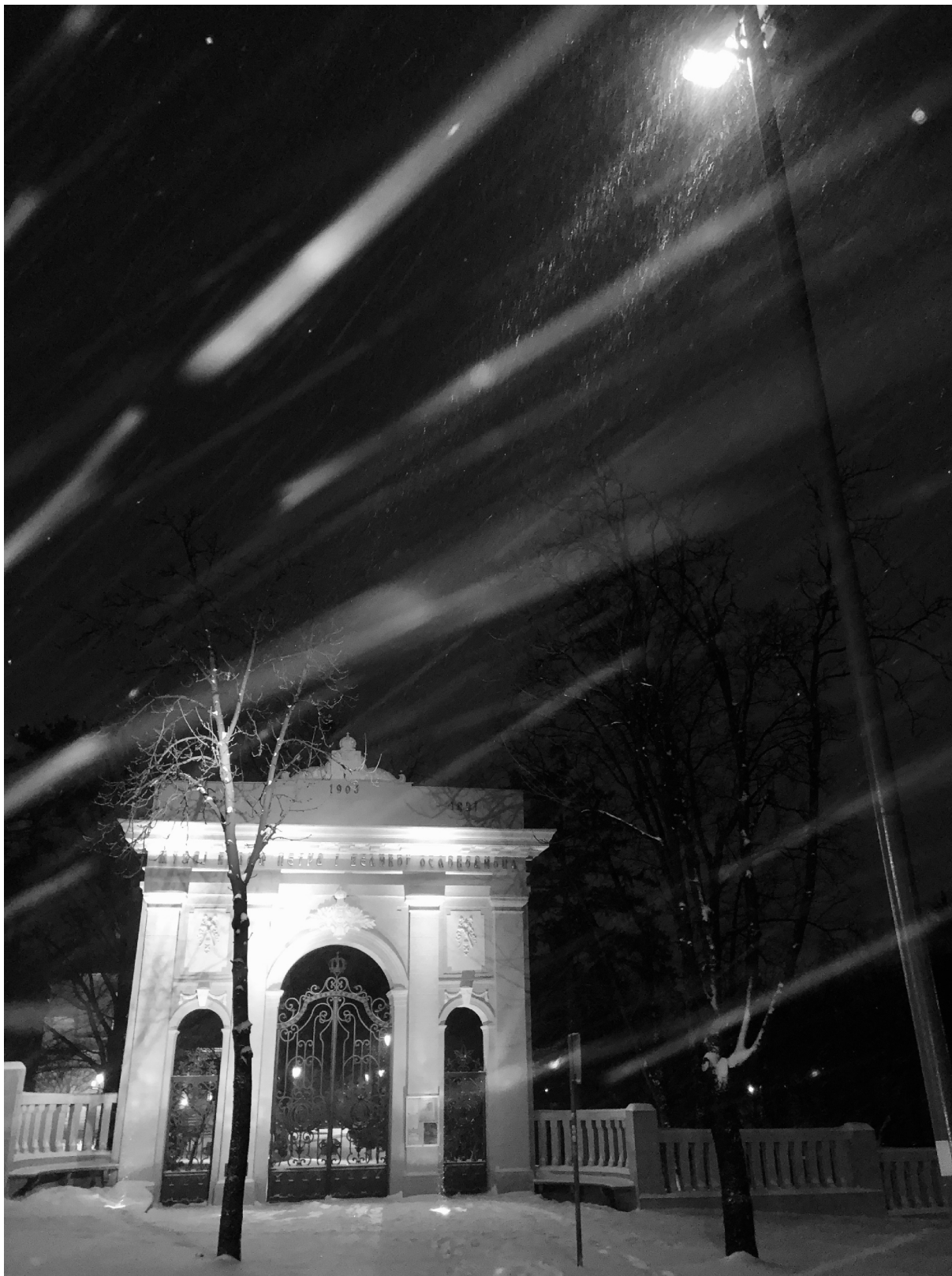
Kod majke Katarine, Pariz 2017 Chez la Mère Catherine, Paris 2017